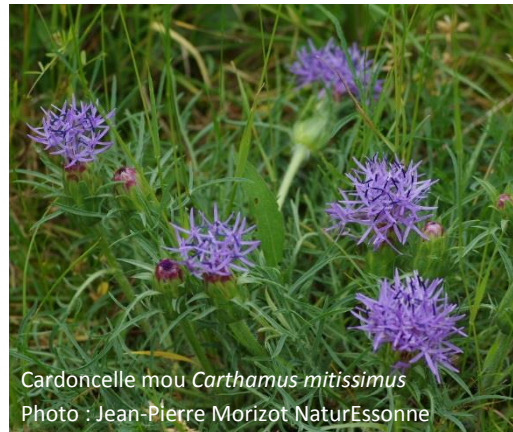
Cardoncelle mou Carthamus mitissimus