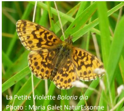
La Petite Violette Boloria dia