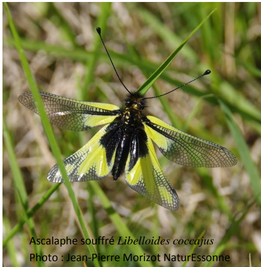
Ascalaphe souffré Libelloides coccajus